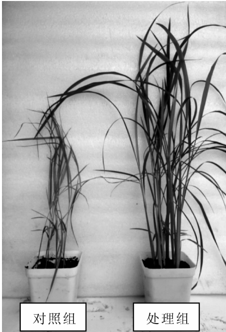
图 2 菌株 4-21 的盆栽防治效果

基上生长繁茂,菌落呈灰白色,有大量孢子粉,中间呈凹陷,边缘整齐不向四周扩散,呈现火山口形状,干燥不透明。